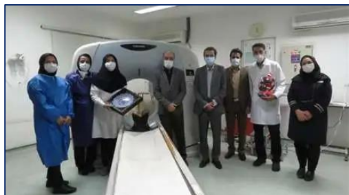
گرامیداشت روز جهانی رادیولوژی در بیمارستان کوثر با حضور