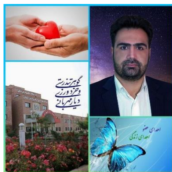
مأموریتی برای نجات و زندگی بخشی... ۱۴۰۰/۰۸/۲۰