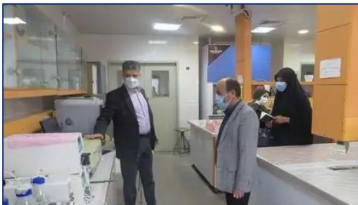
بازدید سرپرست دانشکده داروسازی سمنان از دانشکده شیمی دانشگاه سمنان ۱۴۰۰/۰۸/۳۰