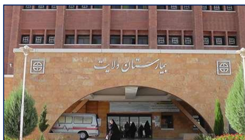
ارائه خدمات مطلوب در بیمارستان ولایت، تحسین خانواده مبتلا به بیماری ویروس کرونا ترخیص شده از این بیمارستان را برانگیخت ۱۴۰۰/۰۸/۰۴