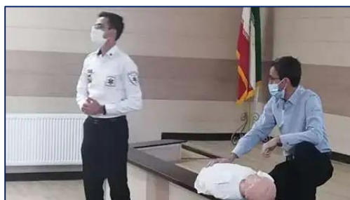
اجرای دوره آموزشی کمک های اولیه برای کارکنان اداره کل فنی و حرفه ای استان سمنان ۱۴۰۰/۰۸/۰۴