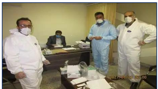
خدمات ۶ ساعته کارشناسان مرکز بهداشت شهرستان سمنان در