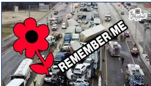
سومین یکشنبه ماه نوامبر؛ یادواره جهانی قربانیان حوادث ترافیکی گرامی باد ۱۴۰۰/۰۸/۲۹