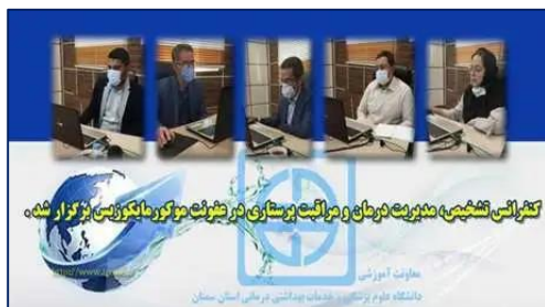
کنفرانس تشخیص، مدیریت درمان و مراقبت پرستاری در عفونت موکورمایکوزیس ۱۴۰۰/۰۸/۰۴