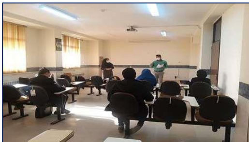
کارگاه آموزشی بسته خدمات پایه سلامت در شبکه بهداشت و درمان شهرستان سرخه برگزار شد ۱۴۰۰/۰۸/۲۶