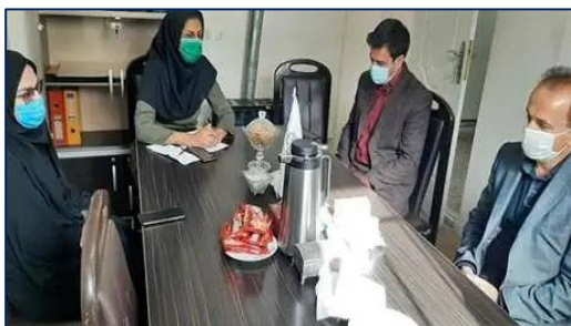
نشست بررسی روند واکسیناسیون دانش آموزان ۱۲-۱۸ سال در شهرستان آرادان برگزار شد ۱۴۰۰/۰۸/۲۶