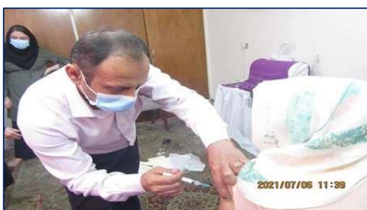
غربالگری فعال بیماران بسترگرا جهت دریافت واکسن کرونا در مرکز بهداشت شهرستان سمنان ۱۴۰۰/۰۸/۲۹