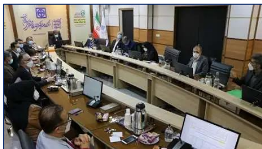
چهل و هشتمین جلسه هیات ممیزه دانشگاه علوم پزشکی استان