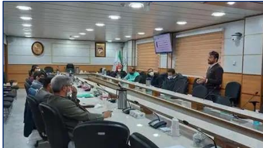
برگزاری کارگاه آموزشی شناخت داروهای فارماکوپه برای کارکنان عملیاتی اورژانس پیش بیمارستانی ۱۴۰۰/۰۸/۲۹