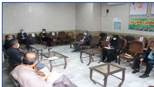
جلسه شورای کانون بسیج جامعه پزشکی و هیئت اندیشه ورز