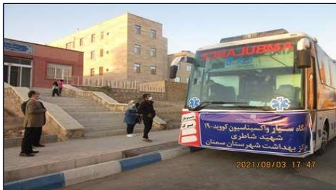
استقرار تیم واکسیناسیون سیار در منطقه میرمحمدخانی شهرستان سمنان ۱۴۰۰/۰۸/۰۵