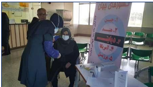
گرمیاداشت هفته دیابت در بیمارستان ولایت شهرستان دامغان ۱۴۰۰/۰۸/۲۹