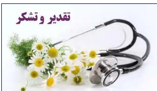
تقدیر و تشکر از پزشکان و پرستاران کلینیک تخصصی و فوق تخصصی شماره یک بیمارستان کوثر ۱۴۰۰/۰۸/۲۹