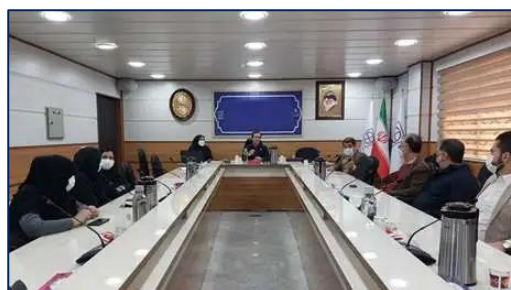
پانصد و بیست و دومین جلسه شورای تخصصی تحقیقات و