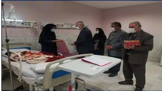
حضور معاون فرهنگی اداره کل فرهنگ و ارشاد در مرکز آموزشی، پژوهشی و درمانی امیرالمومنین (ع) ۱۴۰۰/۰۸/۲۹