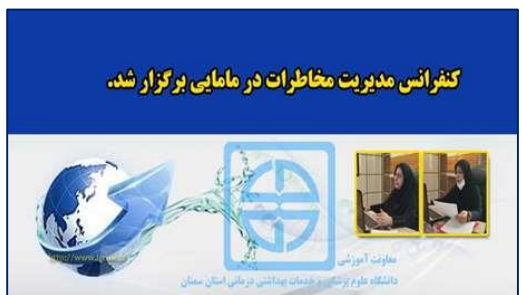
کنفرانس مدیریت مخاطرات در مامایی برگزار شد.