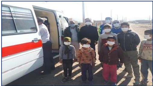
حضور مدیر شبکه بهداشت و درمان دامغان، در منطقه کوه زر و پیگیری و نظارت مستقیم بر تلقیح واکسن کووید ۱۹ ۱۴۰۰/۰۸/۲۹