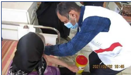
بهره مندی ساکنین مرکز نگهداری سالمندان نور و معلولین گلهای بهشت با تزریق واکسن آنفلوانزا ۱۴۰۰/۰۸/۰۳