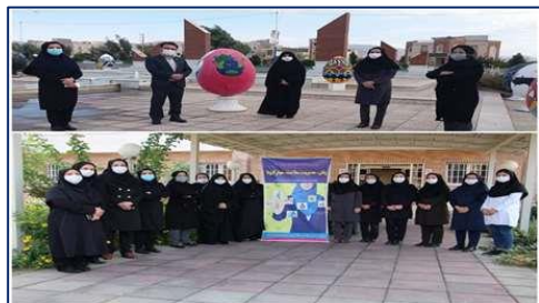
همایش پیاده روی به مناسبت هفته ملی سلامت زنان و پوکی استخوان در شهرستان گرمسار ۱۴۰۰/۰۸/۰۴