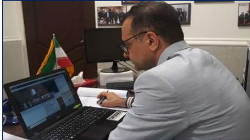
دومین وبینار کشوری بین المللی سازی دانشگاههای کلان منطقه یک کشور برگزار شد ۱۴۰۰/۰۸/۲۵