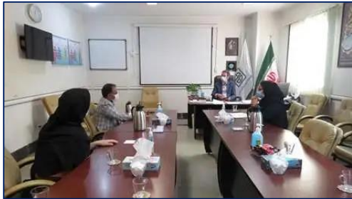
نشست مشترک تیم های مدیریتی بیمارستان های امیرالمومنین(ع) و کوثر سمنان ۱۴۰۰/۰۸/۰۱