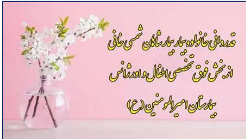
قدردانی خانواده بیمار از بخش فوق تخصصی اطفال و اورژانس بیمارستان امیرالمومنین (ع) ۱۴۰۰/۰۸/۰۱