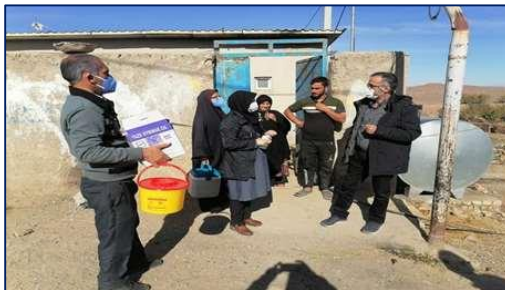
بازدید مدیر شبکه بهداشت و درمان دامغان از منطقه کوه زر و بررسی روند واکسیناسیون کووید ۱۹ ۱۴۰۰/۰۸/۲۶