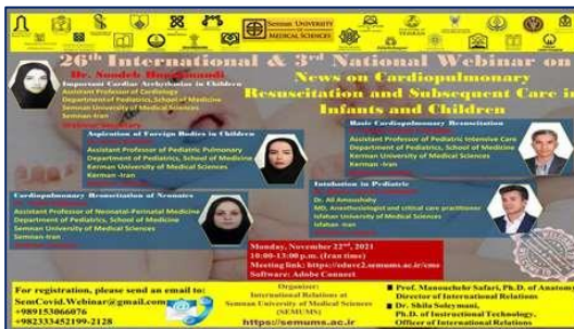
وبینار بیست و ششم از مجموعه وبینارهای بین المللی کووید ۱۹: تشخیص، درمان و مراقبت های بیمارستانی ۱۴۰۰/۰۸/۲۹