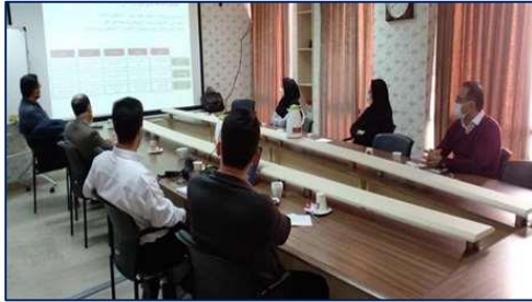
جلسه بسته حرکت به سمت دانشگاههای نسل سوم ازبسته های تحول و نوآوری در آموزش برگزار شد ۱۴۰۰/۰۸/۰۵