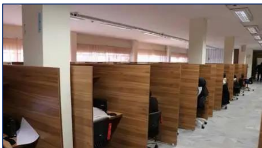
شصت و نهمین دوره آزمون پیش کارورزی و پنجاه و ششمین دوره آزمون علوم پایه دندانپزشکی دانشگاه برگزار شد ۱۴۰۰/۰۸/۲۹