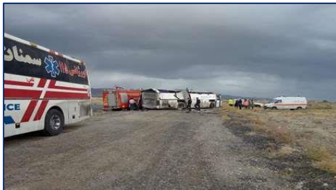
۴۷ مصدوم و ۳ فوتی در پی واژگونی دو دستگاه اتوبوس در محور سرخه - آرادان ۱۴۰۰/۰۸/۰۸