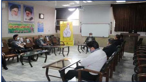
جلسه بررسی وضعیت بیماری کرونا، سالک و بررسی وضعیت موجود و شرایط ارائه خدمات بهداشتی و درمانی در شبکه بهداشت و درمان دامغان ۱۴۰۰/۰۸/۲۹