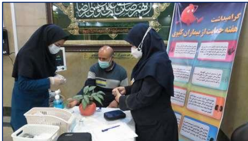
اقدامات مشترک واحد آموزش و ارتقاء سلامت و بخش دیالیز بیمارستان کوثر به مناسبت هفته دیابت و حمایت از بیماران کلیوی ۱۴۰۰/۰۸/۲۹