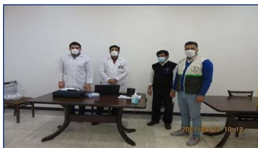
اعزام تیم واکسیناسیون مرکز بهداشت سمنان به شهرک صنعتی