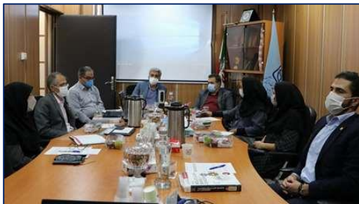
جلسه مصاحبه برای احراز صلاحیت علمی از متقاضیان گروه زنان و زایمان، اطفال و دندان پزشکی ۱۴۰۰/۰۸/۰۳