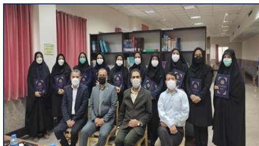
جلسه گرامیداشت هفته کتاب و کتابخوانی و تجلیل از مقام کتابدار در دانشکده پیراپزشکی سرخه برگزار شد ۱۴۰۰/۰۸/۲۶