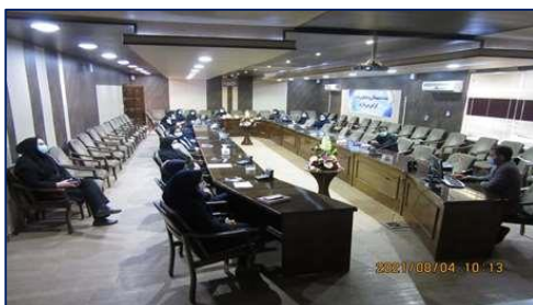
برگزاری دوره آموزشی "آنفلوانزای فوق حاد پرندگان" در مرکز بهداشت شهرستان سمنان ۱۴۰۰/۰۸/۰۸