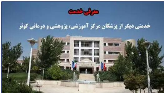
خدمتی دیگر از پزشکان مرکز آموزشی، پژوهشی و درمانی کوثر ۱۴۰۰/۰۸/۲۹